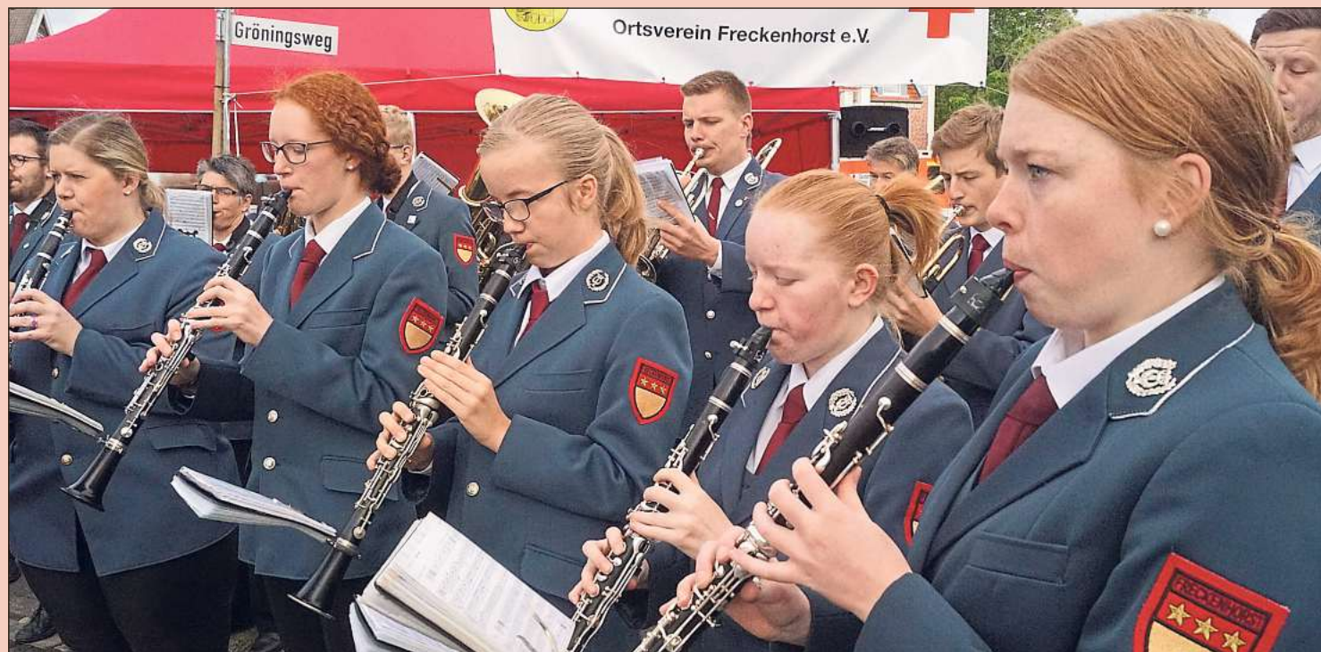
Der Orchesterverein Freckenhorst tritt wie in der Vergangenheit beim Freckenhorster Herbst auf. Mehrmals werden die Musiker ihr Können unter Beweis stellen.