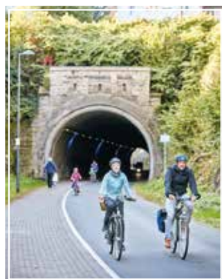
Die Tunnel auf den ehemaligen Bahntrassen gehören heute den Radlern.