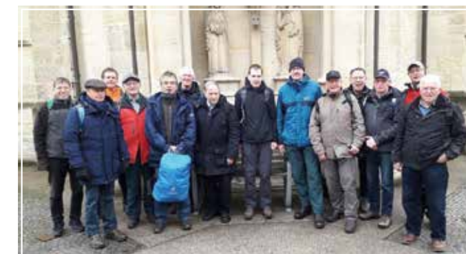
Gruppenfoto von der letzten Etappe im März 2019.

Etappe von Nottuln nach Coesfeld über etwa 18 Kilometer unter die Füße genommen werden. Start der Tour ist um 8.10 Uhr mit dem Bus an der Haltestelle Freckenhorst Mitte (gegenüber ehem. Bröckelmann). Die Wiederkunft in Freckenhorst ist gegen 18.00 Uhr geplant. Kosten entstehen in Höhe von 8 Euro pro Person für den Transfer, für