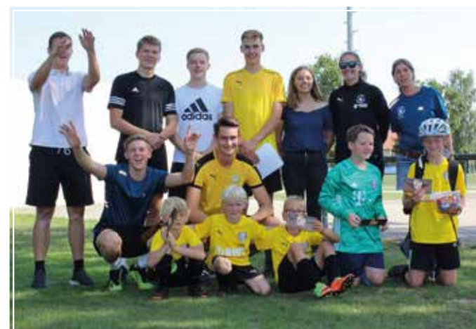
Fußball-Golf: Organisations-Team des TUS mit den Siegern.

Auch wenn aufgrund des Wetters die Tenniseinheit am Sonn-