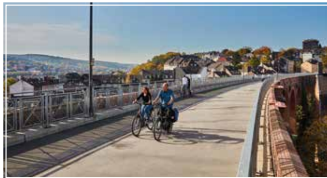
Auf dem „Bergischen Panorama-Radweg“ fährt man hoch über dem Häusermeer über alte Eisenbahn-Viadukte.

Gefördert von der EU und dem Land Nordrhein-Westfalen, bietet das neue Radwegenetz gute Beschilderung, Ausstattung und Service - etwa einen Fahrradbuss, eine Schwebefähre über die Wupper oder eine Seilbahn, die Mensch und Rad auf den Berg trägt. Die Informationsmöglichkeiten zur Vorbereitung und Orientierung sind vielfältig: Unter www.einfach-bergisch-radeln.de werden die Panorama-Radwege anschaulich vorgestellt und mit dem beliebten Online-Tourenplaner Outdooractive verknüpft. Broschüren lassen sich direkt herunterladen, etwa ein Tourenplaner mit Unterkünften und Gastronomie an den Strecken, eine Liste der Leih- und Ladestationen für E-Bikes oder eine Übersichtskarte mit Höhenprofilen und vielen Details. Ein Film vermittelt reizvolle Eindrücke der drei Bergischen Pano-