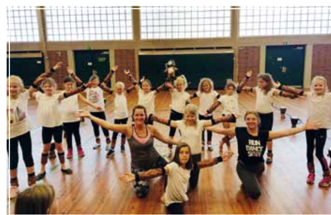
Tanzworkshop: Tanz-Spaß zu Musical-Melodien.

Zur Musik des Musicals König der Löwen wurde in zwei Stunden der Tanz einstudiert. Alle Kinder waren mit viel Begeisterung dabei und hatten reichlich Spaß, dass Erlernte den Eltern zum Abschluss zu präsentieren.