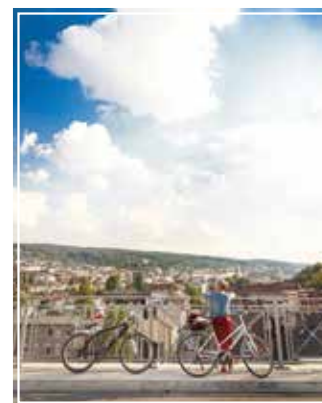
Über den Dächern von Wuppertal, fern vom Straßenverkehr und mit weitem Blick ins Bergische Land.

historischen Altstadt von Remscheid-Lennep mit ihrem fast kreisrunden mittelalterlichen Grundriss. Hier steht auch das Geburtshaus des Physikers Wilhelm Conrad Röntgen mit dem Deutschen Röntgen-Museum.