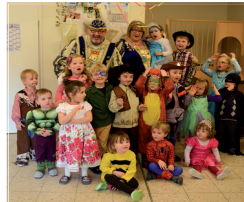
Das Prinzenpaar hier bei den Springfröschen in Freckenhorst.

Als Fazit raten die beiden: „Werdet Prinz oder Prinzessin bei der KG Silber-Blau. Es ist ein unvergessliches Erlebnis!“