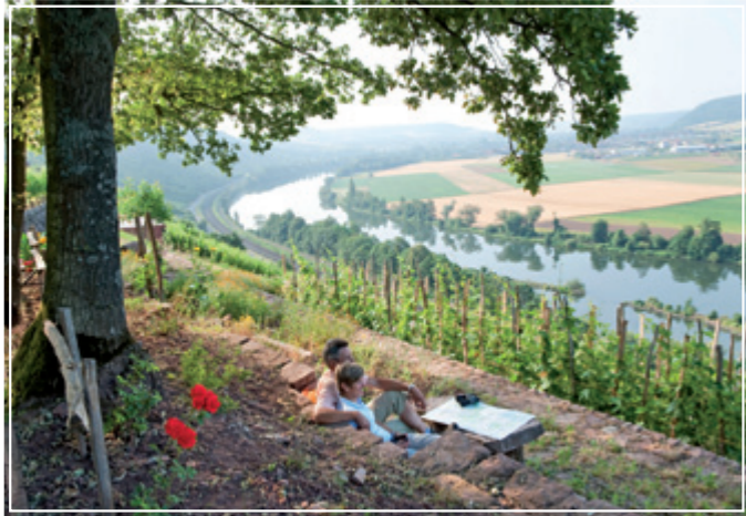
Blick von oben auf das malerische Städtchen Karlstadt am Main.

entsprechend spärlicher ausfallen. Der Johannistag wird von den Spargelbauern demzufolge vor allem aus eigenem Interesse als Stichtag genutzt. Auf diese Weise werden die Äcker geschont und es kann auch im nächsten Jahr wieder eine stolze Spargelernte erzielt werden.